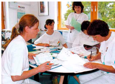
Der Einsatz will gut geplant sein

Über die aktuellen Pflegesätze bzw. Entgelte einzelner Leistungen der Diakonie-Sozialstation informieren wir Sie gern.