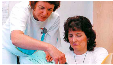
Korrekte Dokumentation sichert den Informationsaustausch

Die Fachkräfte werden auch von ehrenamtlichen Mitarbeiterinnen und Mitarbeitern unterstützt.