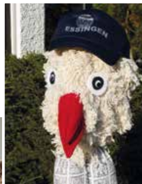
Bobo von der KiBiWo