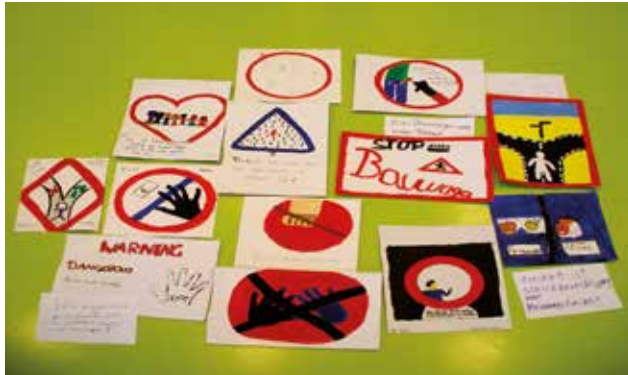
Regeln für die Freiheit

Am Beispiel von Verkehrsschildern sprachen wir darüber, dass Freiheit nicht Anarchie bedeutet, bei der jeder tut, was er will, sondern dass sie immer auch auf allgemein akzeptierte Regeln angewiesen ist, die die Freiheit des einen mit der Freiheit des anderen vermitteln. Am Samstagnachmittag wurde es dann praktisch, und wir schwangen die Pinsel, um unsere eigenen Verkehrsschilder für ein gelungenes Leben zu entwerfen.