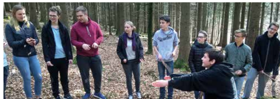
Bilder vom Mitarbeiterwochenende 2017