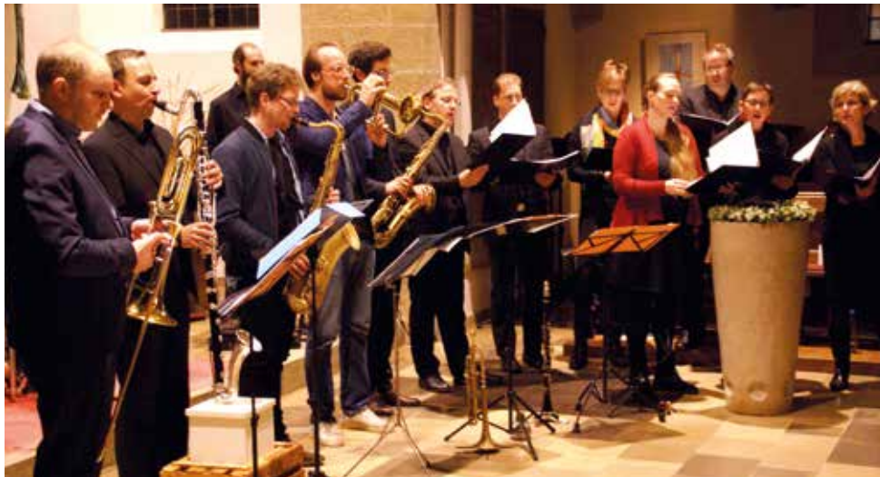
Konzert mit dem Abstrakt Orchester und dem Vokalensemble diapasón am 09.11.2017

Auch bei uns in Essingen war einiges los in diesem Jahr, denn wir hatten ja gleich doppelten Grund zum Feiern: Neben dem ganz großen Reformationsjubiläum auch unser ganz eigenes Jubiläum der Vollendung unserer Quirinuskirche vor fünfhundert Jahren. Ganz besonders aber war vor allem der Einsatz der vielen Ehrenamtlichen und Freiwilligen in unserer Gemeinde, denen an dieser Stelle noch einmal herzlich für ihr großartiges Engagement bei den vielen Veranstaltungen des Reformationsjahres in Essingen gedankt sei.