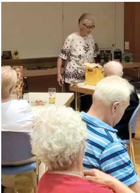
Seniorenfreizeit Februar 2016

Zu Beginn des neuen Jahres gibt es die Informationsprospekte und Anmeldungen in den Schriftenständern in der Kirche und im Gemeindehaus.