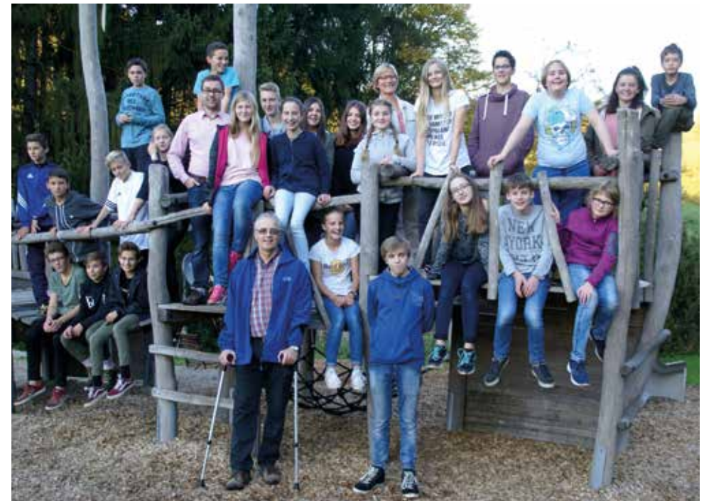
Die Essinger und Lauterburger Konfirmanden