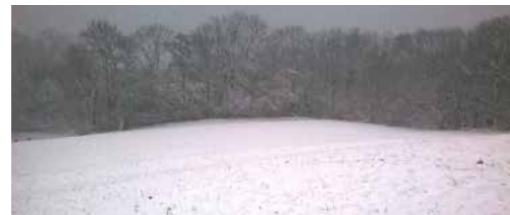
Schnee von gestern