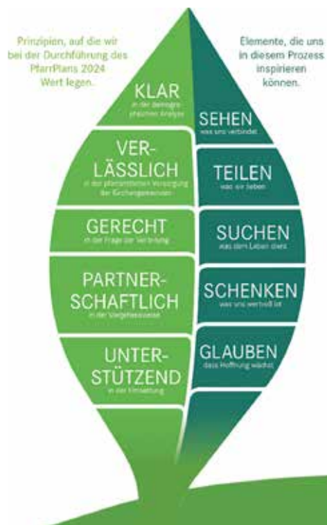
Leitprinzipien des Pfarrplans 2024

Die Reduzierung der Lauterburger Pfarrstelle wird notwendig, weil in der gesamten Landeskirche aufgrund der demografischen Entwicklung in unserem Land die Gemeindegliederzahlen langsam, aber stetig zurückgehen – so auch bei uns. Aus diesem Grund entscheidet die Landessynode alle sechs Jahre, wie viele Pfarrstellen in den einzelnen Kirchenbezirken zu kürzen sind.