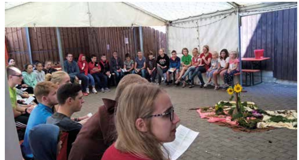
KidsCamp Stocken 2017

Ev. Kirchengemeinde Essingen, BIC: OASPDE6AXXX, IBAN: DE96 6145 0050 0110 0191 49, Stichwort: KidsCamp-Paten.